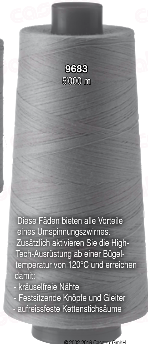
9683 5'000 m

Ces fils offrent tous les avantages d'un retors de guipage et beaucoup de possibilités d'application supplémentaires. La finition vous permet de réaliser, à partir d'une température de repassage de 120°C: