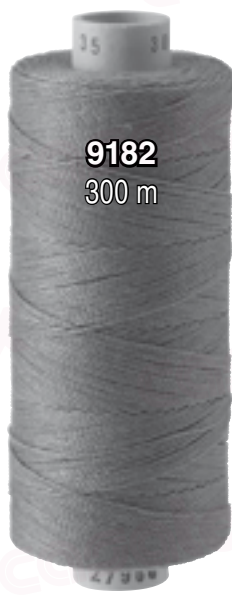
9182 300 m