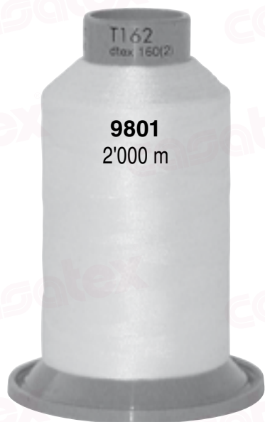
Illustrations en grandeur réelle