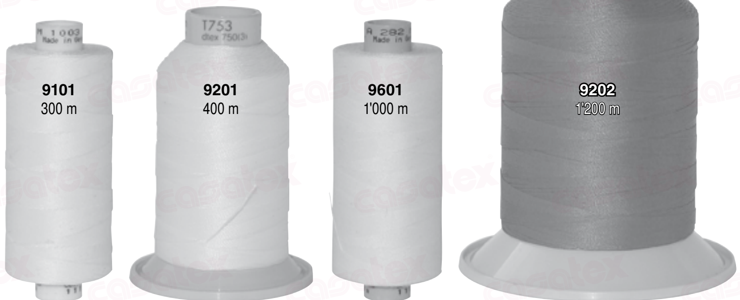
Abbildungen in Originalgröße