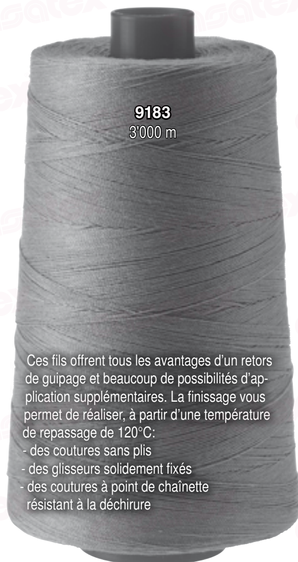
9183 3'000 m