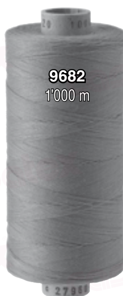
9682 1'000 m